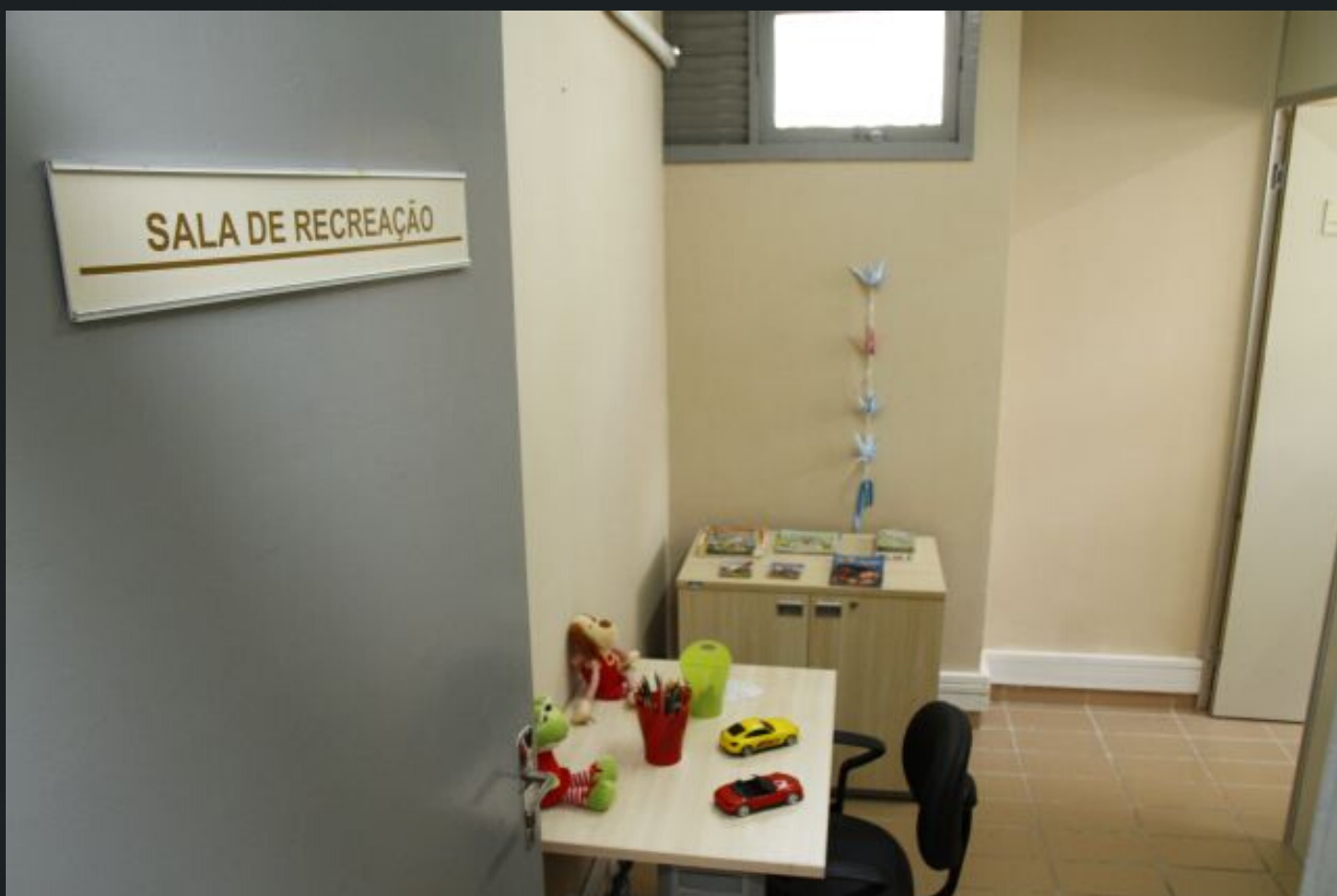
Sala de depoimento acolhedor no Centro Integrado da Criança e do Adolescente (CICA), no Recife.