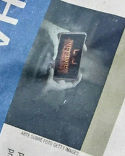
ARTE SOBRE FOTO GETTY IMAGES

GERAL O LADO SOMBRIO DA INTERNET Saiba como usar a rede sem se tornar mais uma vítima das más influências da 'internet'