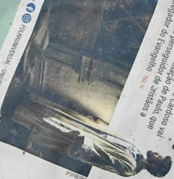
ARTE SOBRE FOTO GETTY IMAGES

Se você tem sofrido, por conta dos problemas e não vê a justiça prevalecer, saiba que há um Justo Juiz disposto a julgar sua causa. Entenda como